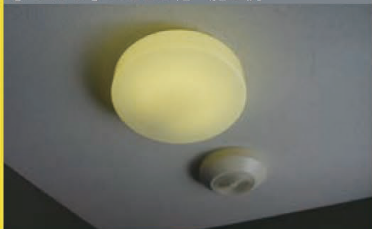
【ハロゲン】のLED化 施工例